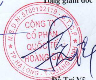
Đỗ Trí Vỹ